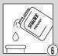
Шаг 6 - Пассивация