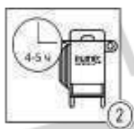
Шаг 2 - Очистка системы с элиминатором®