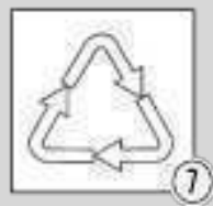
Шаг 7 - утилизация промывочного раствора

При применении рекомендуется использовать защитные очки Pipal® SteelTEX® EYE PROTECTION , перчатки Pipal® SteelTEX® HAND PROTECTION и респиратор Pipal® SteelTEX® RSP , защитную обувь Pipal® SteelTEX® SAP .