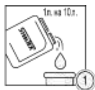
Шаг 1 - Приготовление промывочного раствора