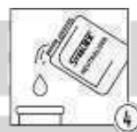
Шаг 4 - Нейтрализация кислотности теплообменника