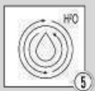
Шаг 5 - Промывка системы водой